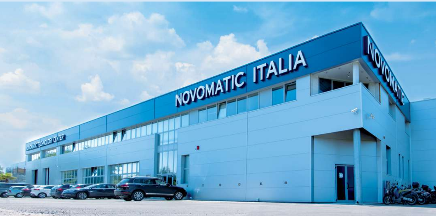
Sede operativa di Rimini - Via Galla Placidia, 2