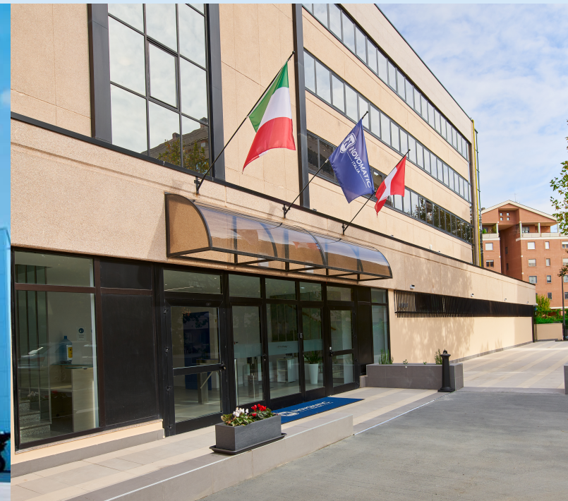
Headquarter di Roma - Via Benedetto Croce 122, 124